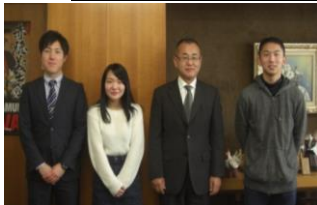
赤穂市長 表敬訪問