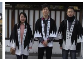
姫路城をバックに