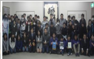
赤穂高校との交流会(集合写真とのぼり旗贈呈)